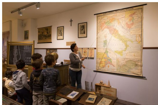
Una visita della struttura

veri e propri oggetti di studio, catalogati o esposti nel museo della scuola Paolo e Ornella Ricca di Macerata. Mercoledì 8 marzo, dalle 8 alle 12, il polo dell'Università di Macerata e il Centro del Riuso del Comune organizzano "Dona la tua memoria", una raccolta di tutti quei materiali, documenti e libri che fanno parte del comune patrimonio culturale della scuola, per dargli una seconda vita.