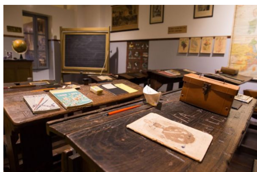
Il museo della scuola

Il museo della scuola di Macerata è alla ricerca di vecchi quaderni, disegni e materiali vari. Tutti hanno in cantina o in soffitta degli scatoloni in cui sono conservati come reliquie i vecchi materiali scolastici. Impolverati, quasi dimenticati li teniamo solo per nostalgia. Da oggi però possono diventare dei