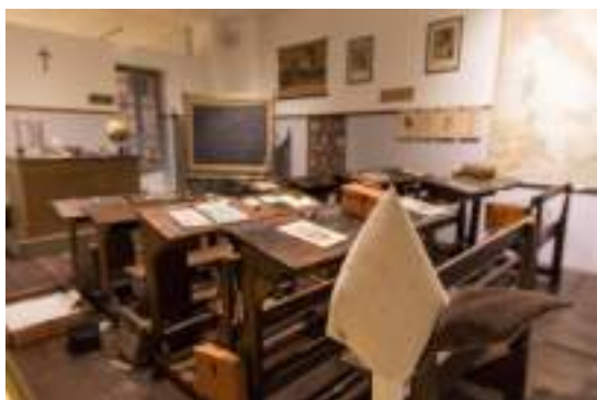
Il museo della scuola