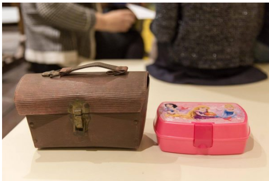
Porta merende a confronto

Il Museo della scuola "Paolo e Ornella Ricca" dell'Università di Macerata partecipa alla prima edizione di Fermhamente, il festival della scienza, da giovedì a domenica a Fermo. Lo staff del Museo sarà impegnato con le scuole e con le famiglie, nello spazio "Buc Machinery", nella preparazione di piatti speciali. Il