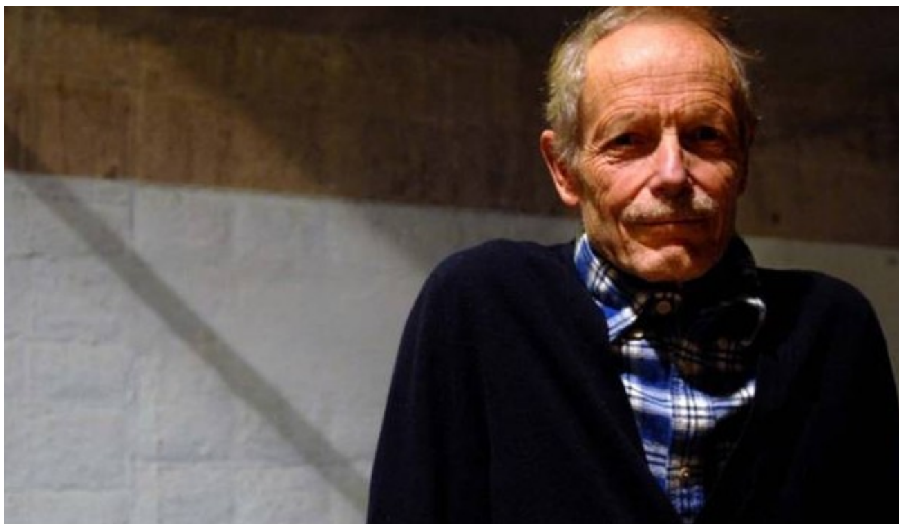
Erri De Luca