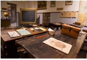
Festa d'apertura del Museo della scuola Ricca: da gennaio a maggio aperto tutte le domeniche

MACERATA – Domenica 8 gennaio, dalle 16 alle 19.30, il Museo della scuola «Paolo e Ornella Ricca» dell'Università di Macerata, in via Carducci 63/a, organizza un pomeriggio con visite libere ad ingresso gratuito.